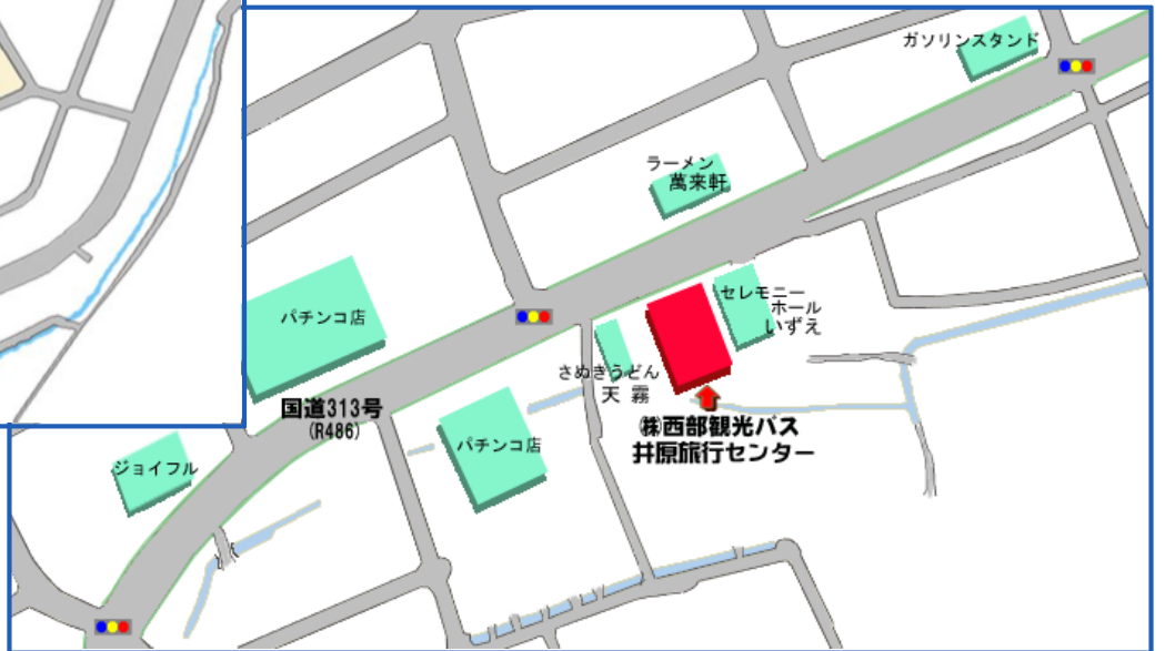
井原旅行センター 周辺図